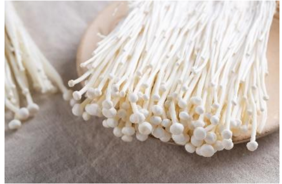
金针菇为白色，茎长，盖小。