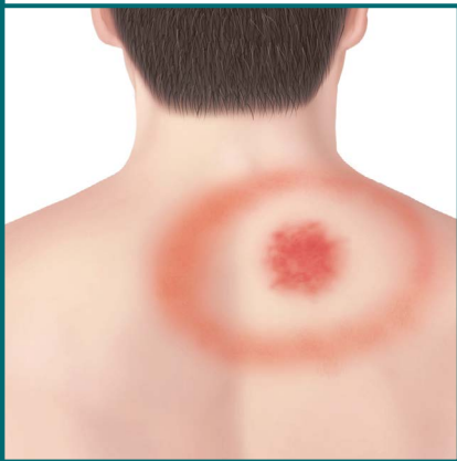
Bull's eye rash sa likod.