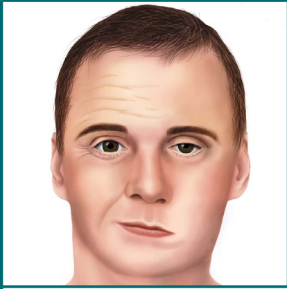
Pagkaparalisa ng Mukha.