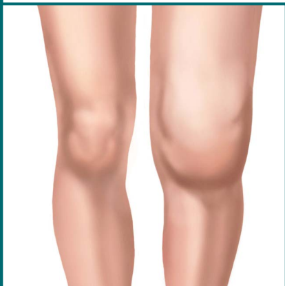
May arthritis na tuhod.